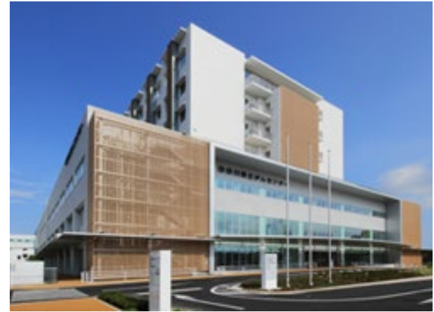
神奈川県立がんセンター特定事業 (横浜市)