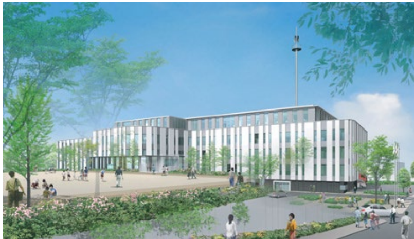
瀬谷区総合庁舎及び公園整備事業 (横浜市)