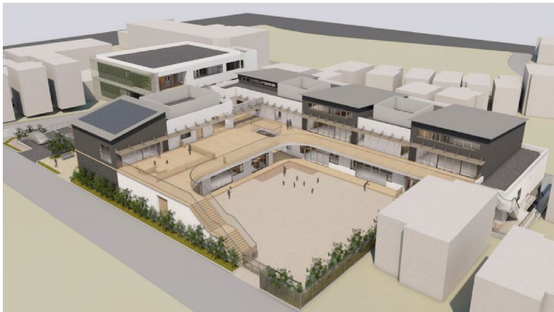
藤が岡二丁目地区再整備事業 (藤沢市)