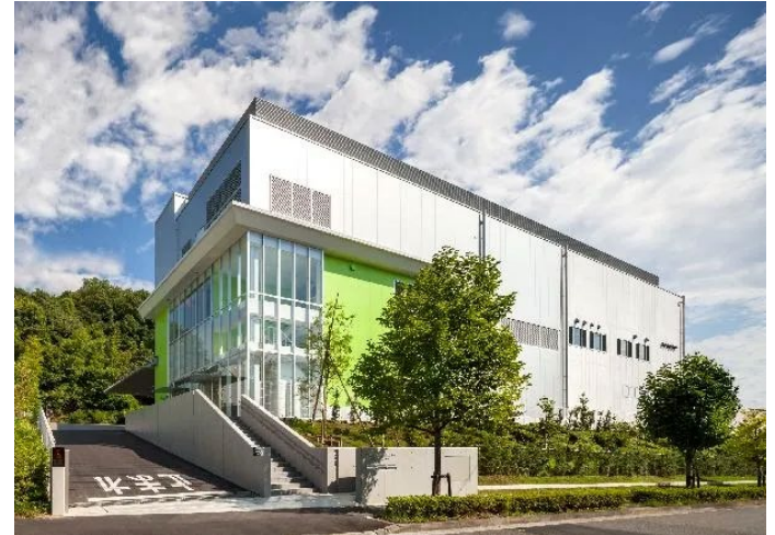
川崎市北部学校給食センター整備事業 (川崎市)