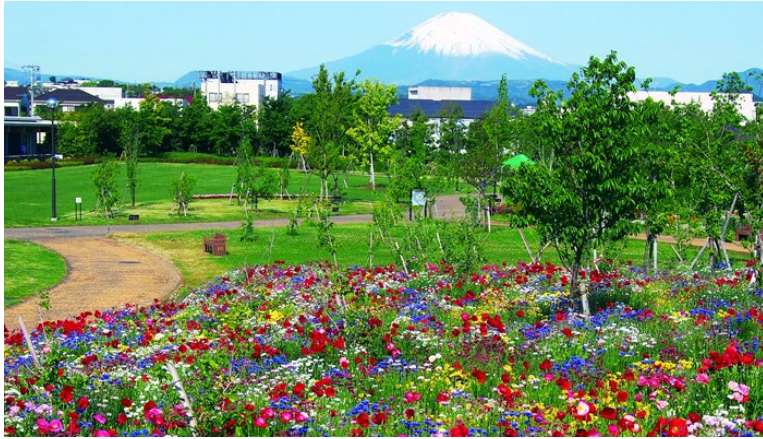
県立花と緑のふれあいセンター整備等事業 (平塚市)