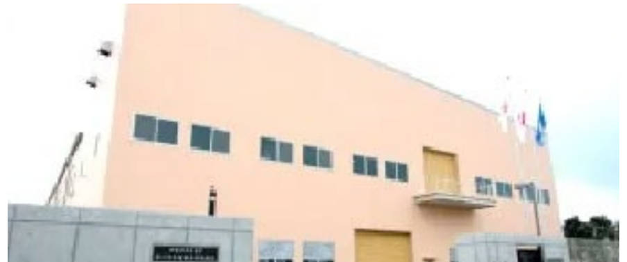
寒川浄水場排水処理施設特定事業 (寒川町)