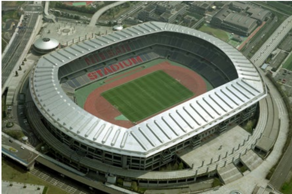
新横浜公園（日産スタジアム）