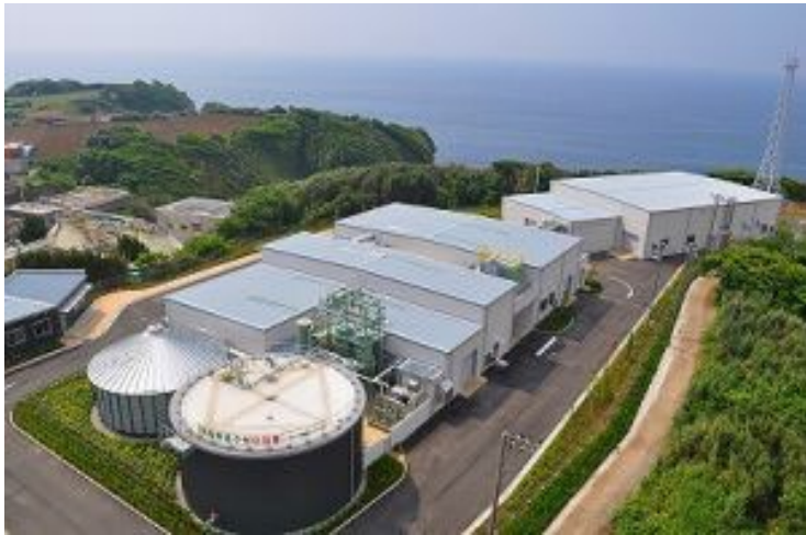
バイオマスセンター施設整備運営事業 (三浦市)