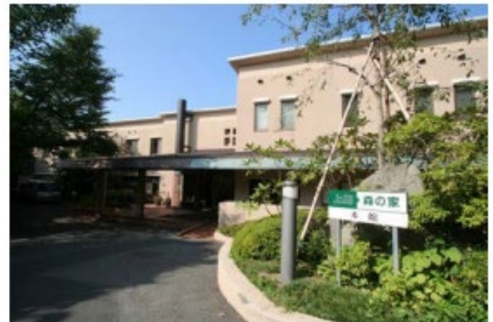
上郷・森の家改修運営事業 (横浜市)